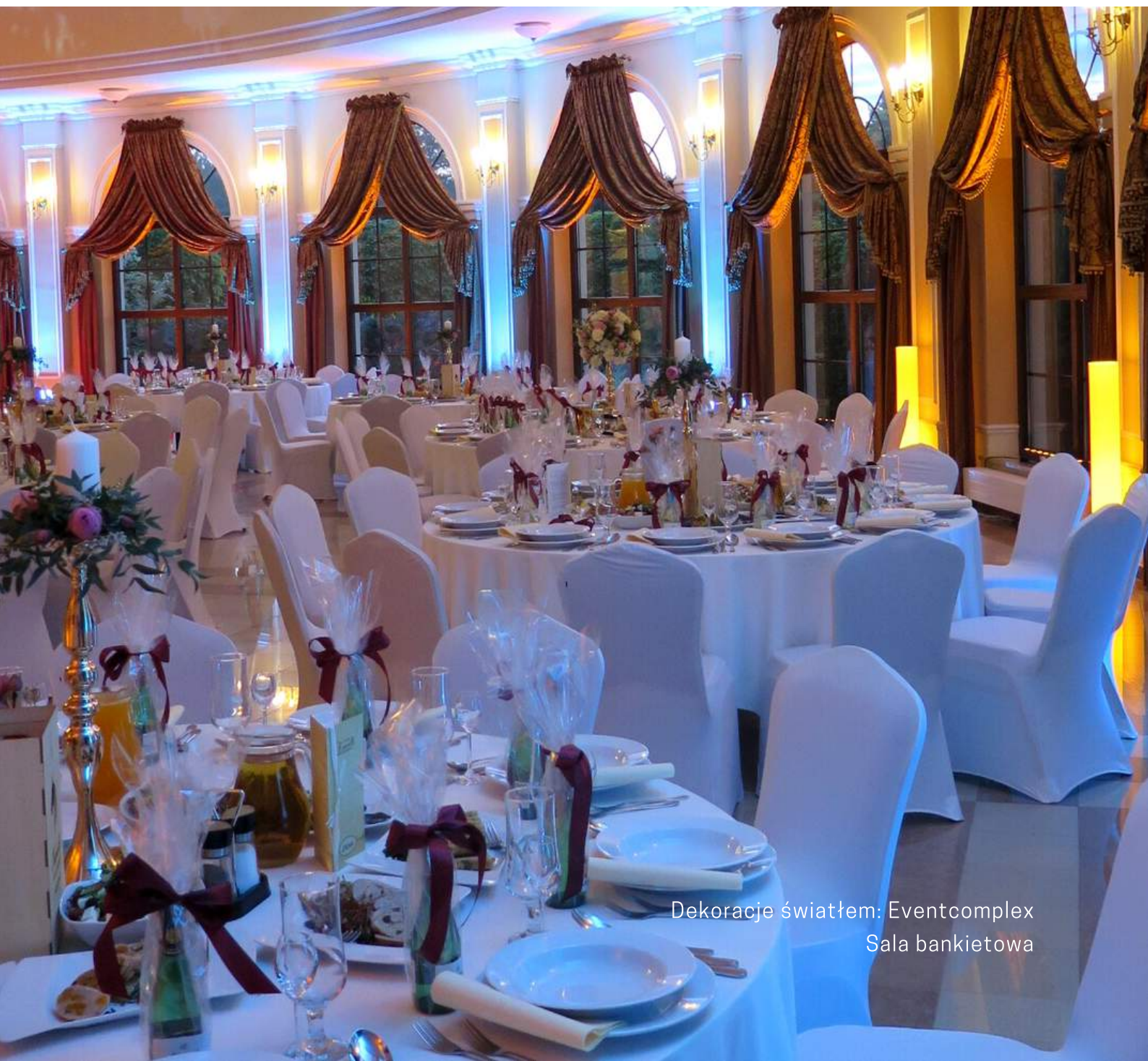
Dekoracje światłem: Eventcomplex Sala bankietowa

Stylowa, dwupoziomowa, ekskluzywna sala bankietowa w stylu barokowym z antresolą o powierzchni 430 m2 jest idealnym miejscem do organizacji „królewskiego przyjęcia weselnego” do 120 osób lub do 160 osób przy wykorzystaniu dwóch poziomów - sali bankietowej i jej antresoli.