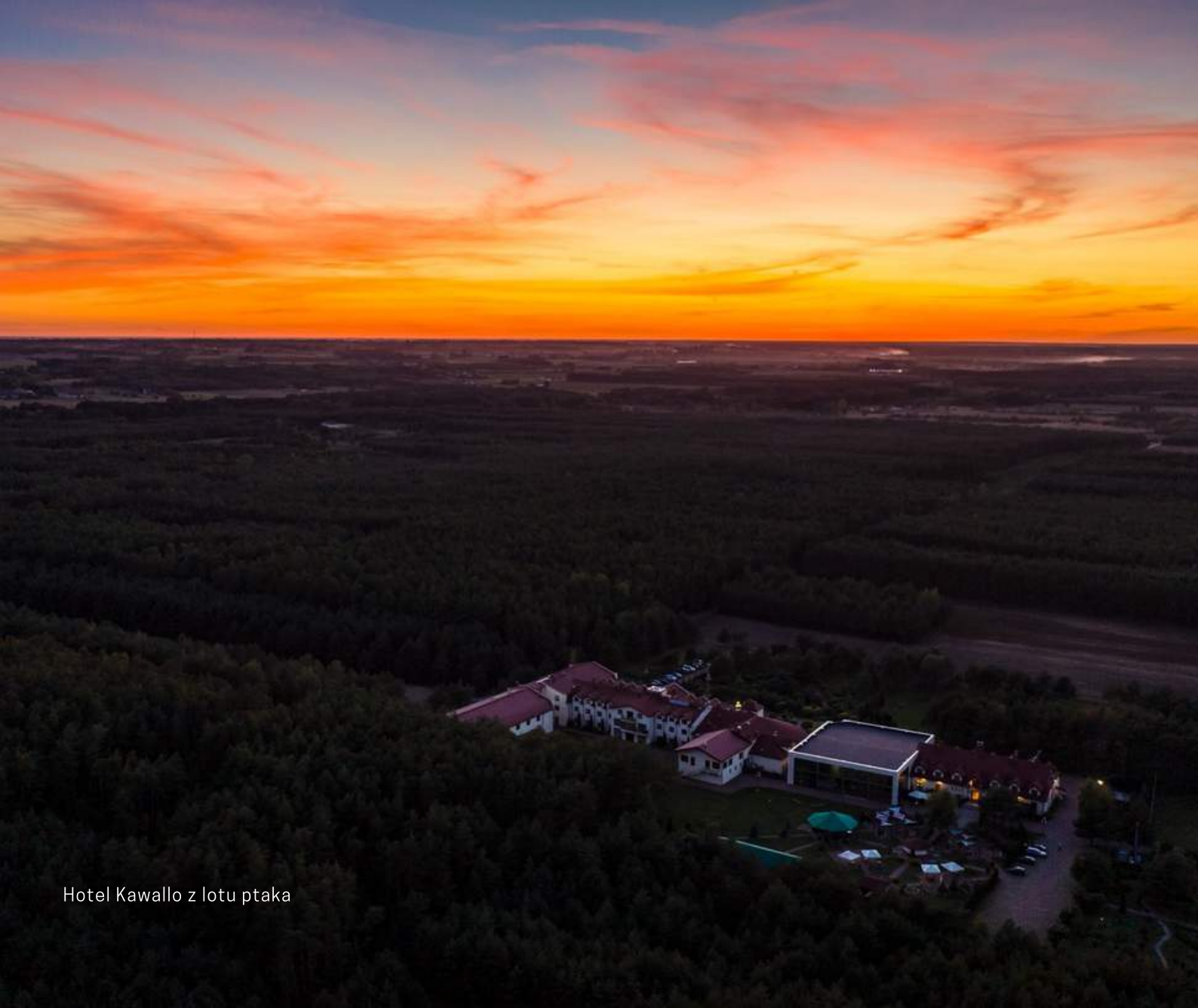
Hotel Kawallo z lotu ptaka