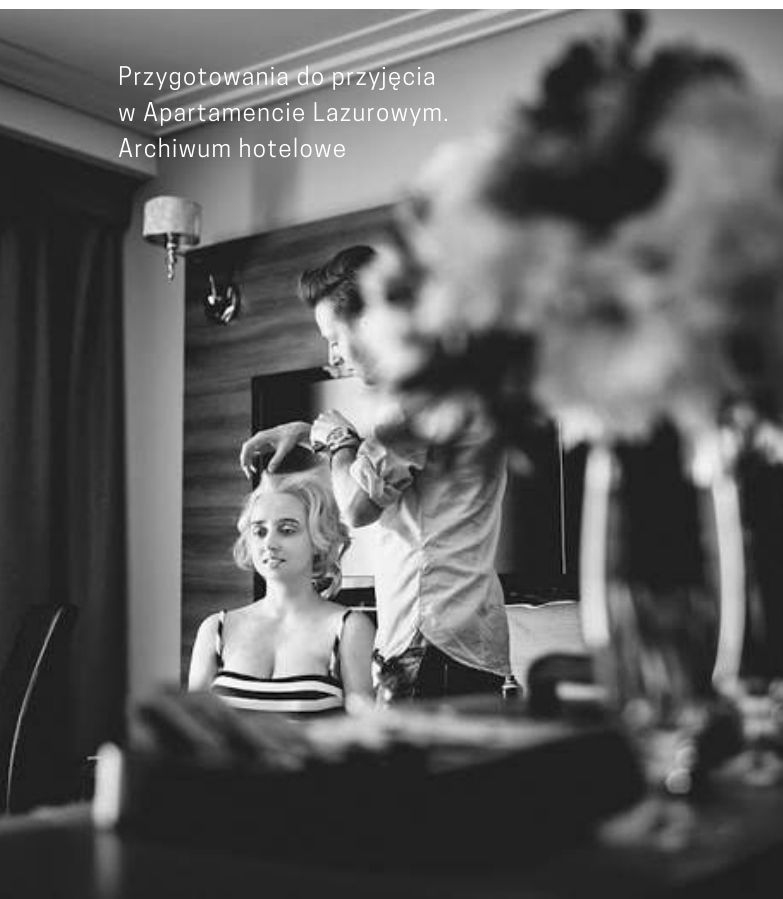
Przygotowania do przyjęcia w Apartamencie Lazurowym.